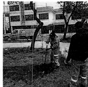
Figuras 1-3. Vista de los trabajos de compensación llevados a cabo por personal de la Alcaldía Gustavo A. Madero.

En virtud de lo antes expuesto, esta Entidad considera procedente emitir la presente resolución, de conformidad con el artículo 27 fracción II de la Ley Orgánica de esta Procuraduría, toda vez que la Dirección General de