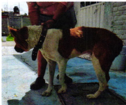
Figura 1. Ejemplar canino motivo de denuncia.

Es de resaltar que, en el Acuerdo de Admisión, que fue enviado por correo electrónico a la persona denunciante, se le hizo de conocimiento que contaba con un término de seis días hábiles para aportar las pruebas que estimara pertinentes en la investigación de los hechos, lo anterior conforme al artículo 90 del Reglamento de la Ley Orgánica de la Procuraduría Ambiental y del Ordenamiento Territorial de la Ciudad de México; sin embargo durante el procedimiento de investigación, no fueron proporcionados elementos de prueba que pudieran determinar incumplimiento a la normatividad en materia de bienestar animal.