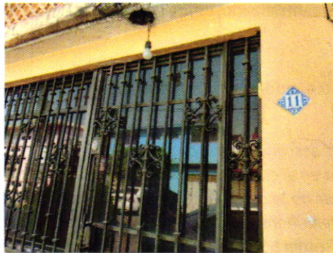
Figura 1. Lugar de los hechos denunciados.

En este sentido, de las constancias que obran en el presente expediente, se desprende que personal de esta Procuraduría llevó a cabo una visita de reconocimiento de hechos, de acuerdo a lo establecido en el artículo 15 BIS 4 fracción IV de la Ley Orgánica de esta Entidad, diligencia durante la cual desde el espacio público no se constató la existencia de algún ejemplar canino, ladridos provenientes del interior de la vivienda en comento u olores característicos de su presencia; no obstante, fijamos en la puerta del inmueble de referencia mediante instructivo el oficio PAOT-05-300/200-349-2021.