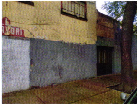
Figura 1. Sitio motivo de denuncia.

En este sentido, de las constancias que obran en el presente expediente, se desprende que personal de esta Subprocuraduría llevó a cabo una visita de reconocimiento de hechos, de acuerdo a lo establecido en el artículo 15 BIS 4 fracción IV de la Ley Orgánica de esta Entidad, diligencia durante la cual desde el espacio público no se constató la existencia de algún ejemplar canino, ladridos provenientes del interior del inmueble de referencia u olores característicos de su presencia, de igual manera se observó que la dirección correcta del sitio referido en el escrito de denuncia es: calle Navarra, número 149, colonia Álamos, Alcaldía Benito Juárez.