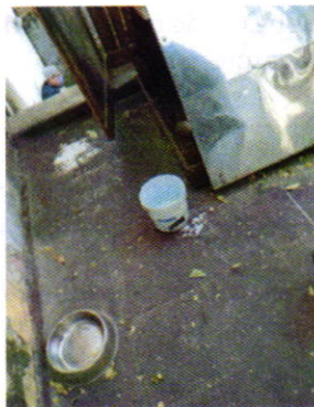
Figuras 2 y 3. Ejemplar canino motivo de denuncia y sus recipientes.

Es de resaltar que, en el Acuerdo de Admisión, que fue enviado por correo electrónico a la persona denunciante, se le hizo de conocimiento que contaba con un término de seis días hábiles para aportar las pruebas que estimara pertinentes en la investigación de los hechos, lo anterior conforme al artículo 90 del Reglamento de la Ley Orgánica de la Procuraduría Ambiental y del Ordenamiento Territorial de la Ciudad de México; sin embargo durante el procedimiento de investigación, no fueron proporcionados elementos de prueba que pudieran determinar incumplimiento a la normatividad en materia de bienestar animal.