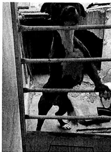
Imagen 2. Ejemplar canino "Nina".