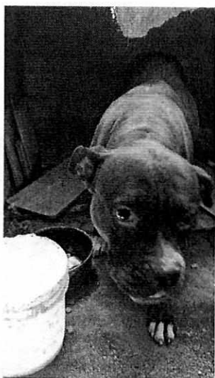
Imagen 3. Canino motivo de denuncia.