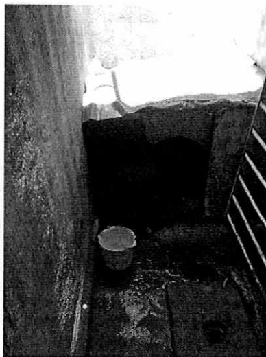
Imagen 4. Sitio de alojamiento y espacio libre y limpio.