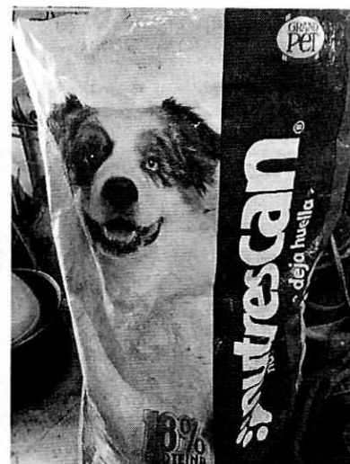
Imagen 5. Alimento proporcionado al canino.

En virtud de lo antes expuesto, esta Entidad considera procedente emitir la presente resolución, de conformidad con el artículo 27 fracción VII de la Ley Orgánica de esta Procuraduría, por el cumplimiento voluntario de las disposiciones jurídicas en materia de bienestar animal.