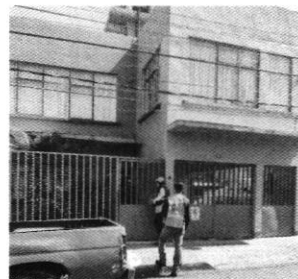
Fotografía 1-2. Inmueble motivo de denuncia y ejemplar canino.

En seguimiento de lo anterior, personal de esta Subprocuraduría llevó a cabo una nueva visita de reconocimiento de hechos con la finalidad de dar seguimiento a la recomendación antes mencionada, sin embargo, el propietario refirió que el canino falleció debido a su edad, por lo existe imposibilidad material por parte de esta Entidad para continuar la presente investigación, toda vez que los hechos que motivaron su denuncia dejaron de existir.