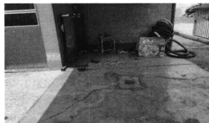
Fotografía 3. Inmueble sin ejemplar canino

En seguimiento de lo anterior, personal de esta Subprocuraduría llevó a cabo una nueva visita de reconocimiento de hechos con la finalidad de dar seguimiento a la recomendación antes mencionada, sin embargo, el propietario refirió que el canino falleció debido a su edad, por lo existe imposibilidad material por parte de esta Entidad para continuar la presente investigación, toda vez que los hechos que motivaron su denuncia dejaron de existir.