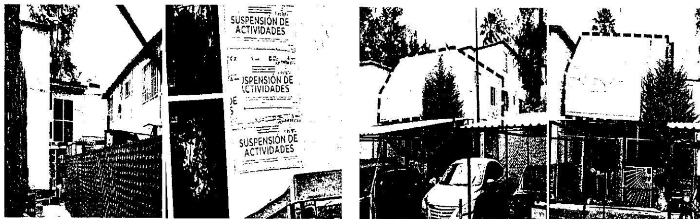
Ampliación con sellos de suspensión de actividades

Sobre el particular, personal adscrito a esta Entidad, se constituyó en las inmediaciones del sitio objeto de investigación, a efecto de realizar el reconocimiento de los hechos denunciados, levantando el acta circunstanciada correspondiente, en la que se hizo contar que el sitio denunciado se trata de una unidad habitacional, el edificio 1G cuenta con 3 niveles, desde la vía pública se observó que en el departamento denunciado número 1G-204 llevó a cabo la ampliación del inmueble, consistente en una construcción de aproximadamente 5.00 por 2.50 metros a base de muros de tabique, castillos, trabes de concreto, loza y ventanas, la cual se desplantó sobre lo que parece ser un área común, la construcción cuenta con sellos de suspensión de actividades impuestos por la Dirección General Jurídica y de Gobierno de la Alcaldía Tláhuac, no se constató el derribo de arbolado ni la afectación de algún área verde en el sitio, como a continuación se muestra: -----