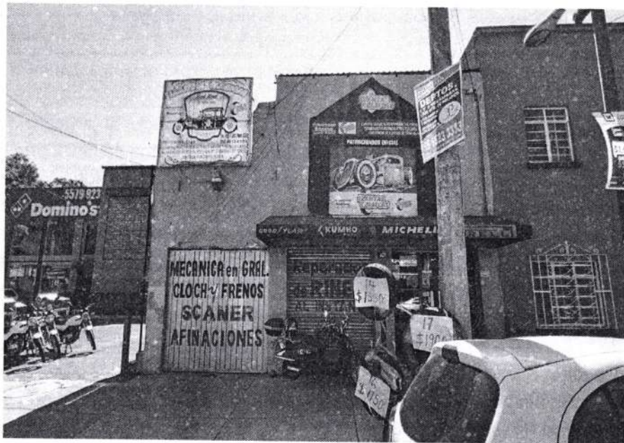
Fuente PAOT: Reconocimiento de hechos de fecha 08 de noviembre de 2022.

Durante la visita de reconocimiento de hechos realizada por personal adscrito a esta Subprocuraduría, en el predio ubicado en Avenida Santiago número 2917, Colonia Iztaccíhuatl, Alcaldía Benito Juárez, se observó un inmueble de 2 niveles de altura, con denominativo "MECÁNICA en GRAL, CLOCH Y FRENOS, SCANER Y ALINEACIONES", "LLANTAS CLÁSICAS"; sin constatar trabajos, emisiones sonoras ni vibraciones; asimismo se observó en el acceso principal el "Aviso para el funcionamiento de Establecimientos Mercantiles con giro de Bajo Impacto", folio BJA VAP2018-05-2200241236, para el predio ubicado en Avenida Santiago 2907, es decir un predio distinto al objeto de denuncia. -----