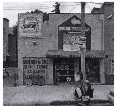
Imagen de fecha agosto de 2022.

En este sentido, en atención al oficio PAOT-05-300/300-9168-2022, una persona que se ostentó como Titular del establecimiento mercantil manifestó que dicho local se utiliza como bodega, sin que se realicen actividades de taller mecánico ni la venta de artículos; sin embargo inició la obtención de Uso de Suelo por reconocimiento de actividad. -----