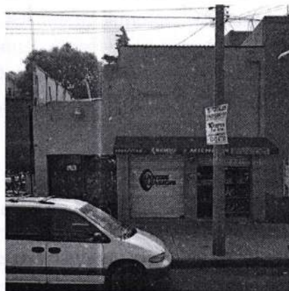
Imagen de fecha diciembre de 2018.