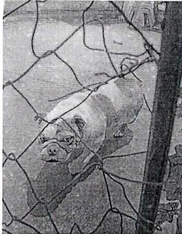
Imagen 2. Ejemplar canino motivo de la denuncia.