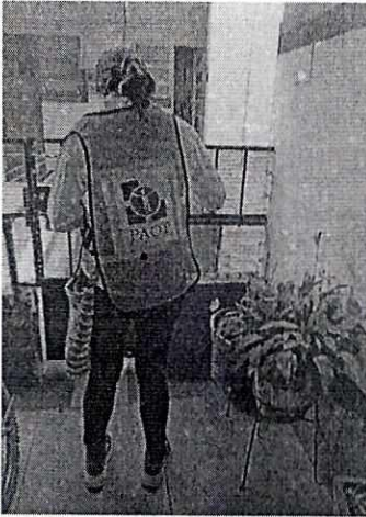
Imagen 1. Personal de la Procuraduría presentándose en el domicilio en comento.