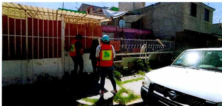
Fotografía 1. Sitio de los hechos.