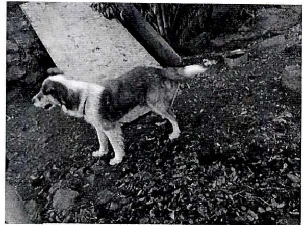
Imagen 2. Canido de nombre "Boby".

En seguimiento de lo anterior, personal de esta Subprocuraduría llevó a cabo una nueva visita de reconocimiento de hechos con la finalidad de dar seguimiento a las recomendaciones antes mencionadas, constatando que la persona encargada del cuidado de los caninos llevó a cabo las recomendaciones realizadas por personal de esta Entidad.