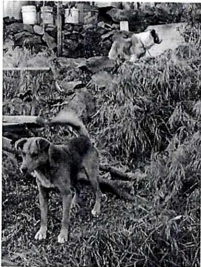
Imagen 1. Canido de nombre "Canelo".