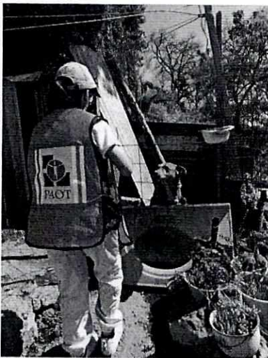
Imagen 3. Sitio de alojamiento de "Canelo"

En seguimiento de lo anterior, personal de esta Subprocuraduría llevó a cabo una nueva visita de reconocimiento de hechos con la finalidad de dar seguimiento a las recomendaciones antes mencionadas, constatando que la persona encargada del cuidado de los caninos llevó a cabo las recomendaciones realizadas por personal de esta Entidad.