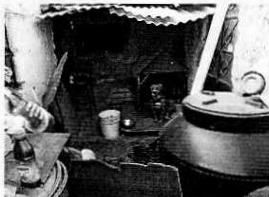
Fotografía 1. Vista del ejemplar canino motivo de denuncia.