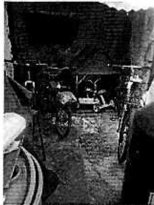
Fotografía 2. Vista del sitio en el cual se encontraba el ejemplar canino motivo de denuncia.

En seguimiento a la denuncia, se realizó un segundo reconocimiento de hechos por personal adscrito a esta Subprocuraduría, en la que no se constató la existencia del canino; no obstante, el propietario del animal refirió que este había sido llevado al Estado de Veracruz, con la finalidad de mejorar sus condiciones de bienestar.