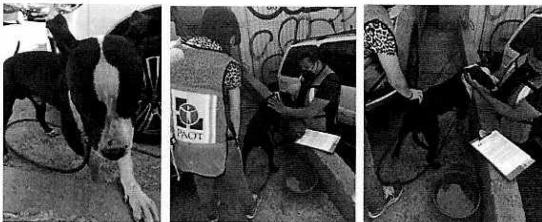
Imágenes 1-3. Interacción social del ejemplar canino motivo de la denuncia, se advierte tazón de agua limpia y longitud de 5 metros de la correa.