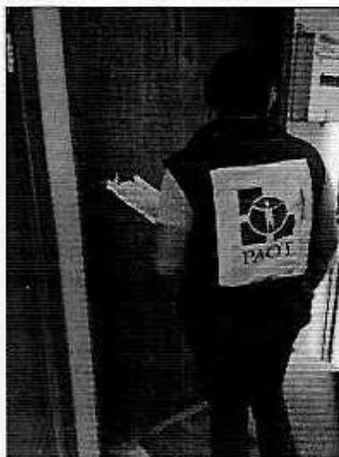
Imágenes 1y 2. Personal presentándose en el domicilio motivo de la denuncia.