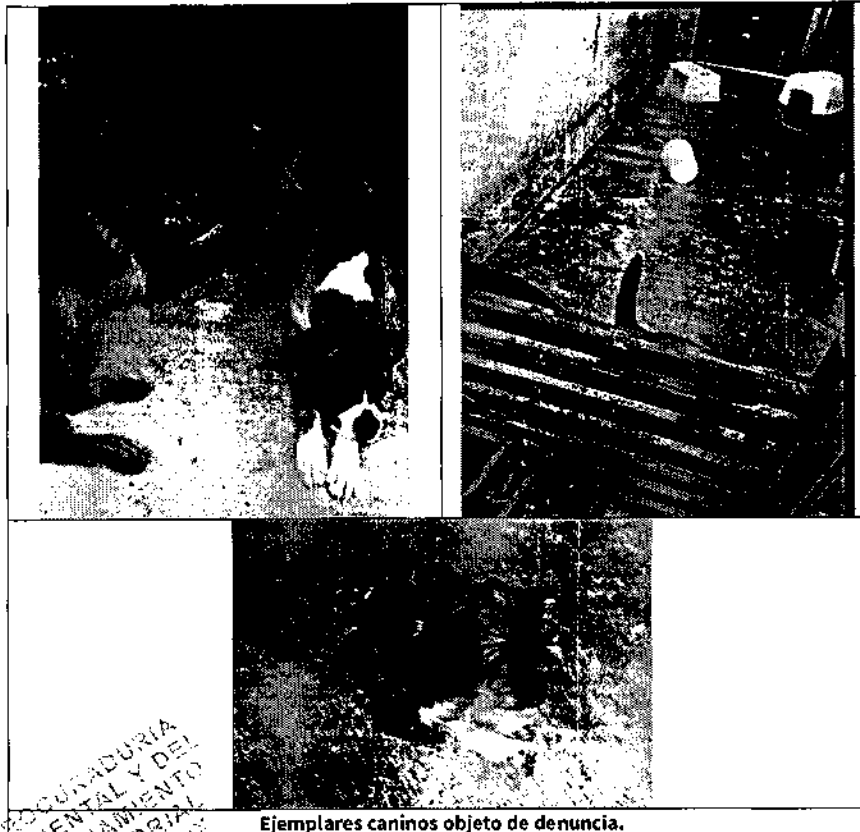
Ejemplares caninos objeto de denuncia.

Finalmente, se hizo del conocimiento de la persona responsable de los ejemplares caninos en comento, la legislación en materia de bienestar animal conminándola a su debido cumplimiento.