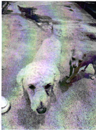
Fotografía 1. Vista de los ejemplares caninos.