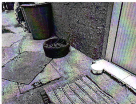
Fotografía 2. Lugar de alojamiento de los ejemplares caninos.