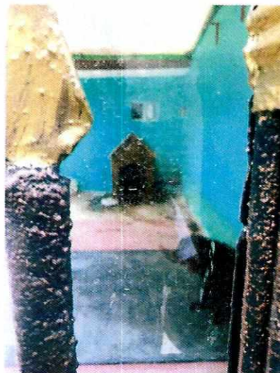
Imagen 2. Ejemplar canino observado desde vía pública.

En seguimiento a la presente investigación, personal de esta Entidad realizó una llamada telefónica, en donde tuvo comunicación con la persona denunciante, en el mismo acto se le dio a conocer las actuaciones realizadas por esta Procuraduría sobre la investigación, a lo cual la persona denunciante mencionó que, derivado de las visitas realizadas en atención a la denuncia, el propietario mejoró las condiciones del ejemplar canino, por lo cual estaba conforme con las acciones realizadas y la emisión de la presente Resolución.