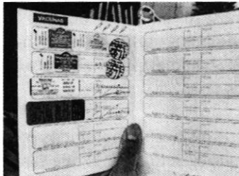
En la imagen se observa la cartilla de vacunación de "Pelusa".