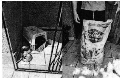
En la imagen se observa el lugar de alojamiento y el bulto de alimento de los caninos.