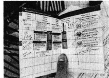
En la imagen se observa la cartilla de vacunación de "Greñas".