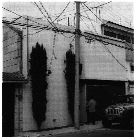
Imagen No. 1 – Inmueble de 2 niveles, con características físicas de recientes de remodelación y ampliación de barda en fachada.

Durante los reconocimientos de hechos realizados por personal adscrito a esta Subprocuraduría, se constató un inmueble de 2 niveles con trabajos recientes de remodelación consistentes en aplicación de pintura y sustitución de acabados, así como la ampliación de la barda ubicada en el frente del predio, no se constató la fusión de predios (ver imagen 1). -----