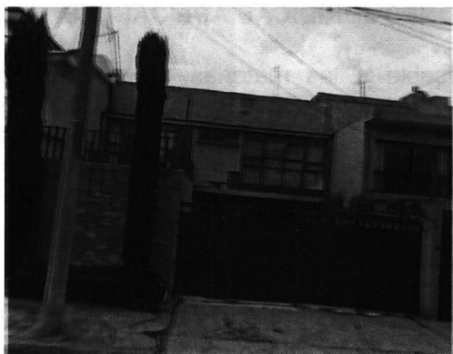
Imagen No. 2 – Inmueble objeto de investigación, el cual consta de 2 niveles, cuyas características arquitectónicas son propias de una vivienda unifamiliar.