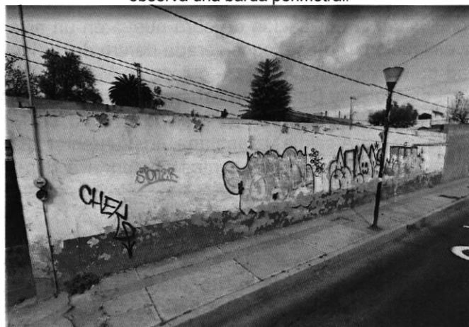
Imagen No. 4 Predio objeto de investigación, en el cual se observa una barda perimetral.