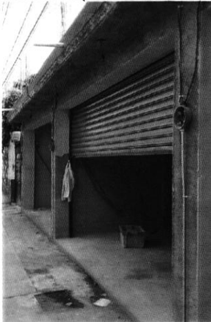
Imagen No. 1 Predio objeto de investigación en el que se ejecutó una obra nueva (locales comerciales de 1 nivel).