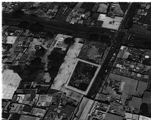
Imagen No. 5 Predio objeto de investigación, en el cual se observa que en el año 2018 no tenía ninguna construcción al interior.