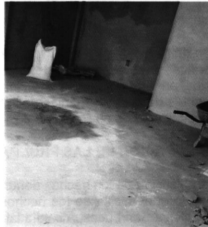
Imagen No. 2 Interior de uno de los locales se observan de reciente construcción.