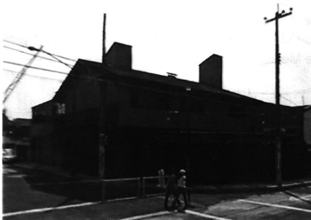
Imagen No. 2 Inmueble objeto de investigación de 2 niveles,