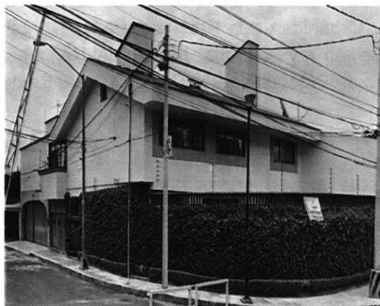
Imagen No. 3 Se observa el inmueble conformado por 2 niveles.

Fuente: captura de Street View de junio de 2017.