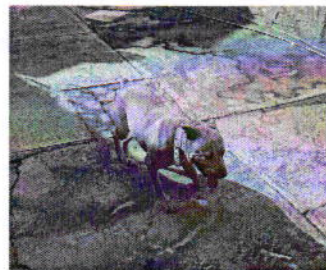
Figura 5. Ejemplar canino "Nala".

En seguimiento a la denuncia, la persona que se ostentó como propietaria del ejemplar canino "Nala" remitió mediante correo electrónico evidencia fotográfica en la cual se observa que su animal de compañía no se encuentra amarrado de manera permanente, observándose deambulando libremente en el patio de vivienda en comento.