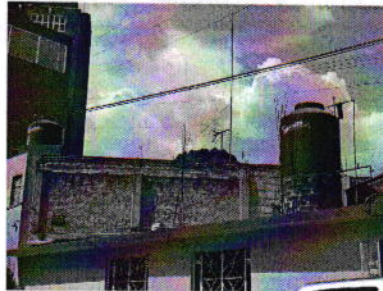
Figura 1. Sitio motivo de denuncia.

En este sentido, de las constancias que obran en el presente expediente, se desprende que personal de esta Subprocuraduría llevó a cabo una visita de reconocimiento de hechos, de acuerdo a lo establecido en el artículo 15 BIS 4 fracción IV de la Ley Orgánica de esta Entidad, diligencia durante la cual desde el espacio público no se constató la existencia de algún ejemplar canino, ladridos provenientes del interior del inmueble de referencia u olores característicos de su presencia, de igual manera se observó que la dirección correcta del sitio referido en el escrito de denuncia es: calle 12-A, manzana 1, lote 3, colonia Belisario Domínguez Sección XVI, Alcaldía Tlalpan.