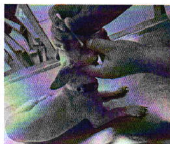
Figura 6. Vista del ejemplar canino "Luz".

En seguimiento de lo anterior, personal de esta Subprocuraduría tuvo comunicación con la persona propietaria del ejemplar canino "Luz" a través de una aplicación de mensajería instantánea para teléfonos inteligentes; al respecto, remitió imágenes fotográficas de la receta médica emitida por el médico veterinario encargado de su revisión, así como del tratamiento recomendado para atender la inflamación ocular que presenta.