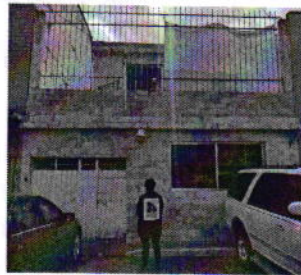
Figura 1. Vista del sitio referido en el escrito de denuncia.

En este sentido, de las constancias que obran en el presente expediente, se desprende que personal de esta Procuraduría llevó a cabo una nueva visita de reconocimiento de hechos, diligencia durante la cual se constató lo siguiente: