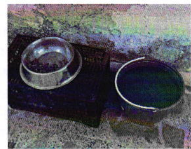
Figuras 2, 3 y 4. Ejemplares caninos motivo de denuncia, alimento y agua proporcionados.

Es de resaltar que, en el Acuerdo de Admisión, que fue enviado por correo electrónico a la persona denunciante, se le hizo de conocimiento que contaba con un término de seis días hábiles para aportar las pruebas que