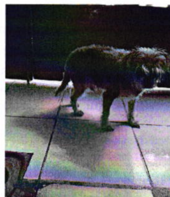
Figura 6. Vista del ejemplar canino "Luz".

En virtud de lo antes expuesto, esta Entidad considera procedente emitir la presente resolución, de conformidad con el artículo 27 fracción VII de la Ley Orgánica de esta Procuraduría, por el cumplimiento voluntario de las disposiciones jurídicas en materia de bienestar animal.