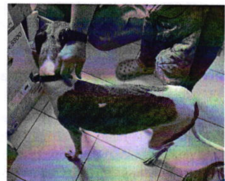
Figuras 1, 2 y 3. Ejemplares caninos motivo de denuncia.

Derivado de lo observado, se realizaron las siguientes recomendaciones: