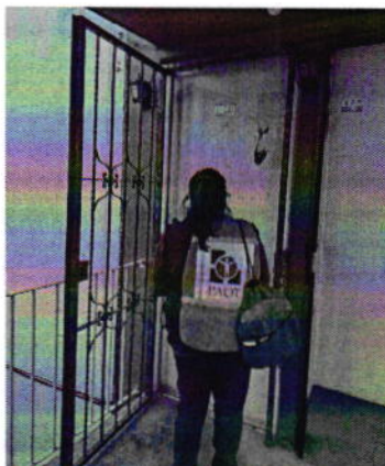
Figura 1. Sitio motivo de denuncia.

En este sentido, de las constancias que obran en el presente expediente, se desprende que personal de esta Subprocuraduría llevó a cabo una visita de reconocimiento de hechos, de acuerdo a lo establecido en el artículo 15 BIS 4 fracción IV de la Ley Orgánica de esta Entidad, diligencia durante la cual desde el área común del departamento de referencia, se constató la existencia de al menos dos ejemplares caninos, los cuales empezaron a ladrar al percatarse de la presencia del personal actuante; sin embargo, no fue posible localizar a su persona propietaria, motivo por el cual procedimos a fijar en la puerta del sitio de referencia mediante instructivo el oficio PAOT-05-300/200-0181-2022.