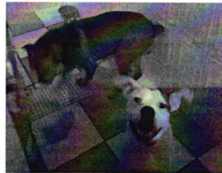
Figuras 2 y 3. Ejemplares caninos motivo de denuncia.

Es de resaltar que, en el Acuerdo de Admisión, que fue enviado por correo electrónico a la persona denunciante, se le hizo de conocimiento que contaba con un término de seis días hábiles para aportar las pruebas que estimara pertinentes en la investigación de los hechos, lo anterior conforme al artículo 90 del Reglamento de la Ley Orgánica de la Procuraduría Ambiental y del Ordenamiento Territorial de la Ciudad de México; sin embargo durante el procedimiento de investigación, no fueron proporcionados elementos de prueba que pudieran determinar incumplimiento a la normatividad en materia de bienestar animal.