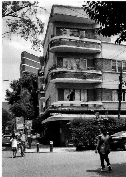
Fotografía 1. Fachada del establecimiento objeto de denuncia ubicado en la planta baja del inmueble.

En este sentido, personal de esta Subprocuraduría llevó a cabo un estudio de emisiones sonoras desde el punto de denuncia, durante el cual se constató que el ruido proveniente del sistema de extracción de aire y enfriamiento del establecimiento motivo de denuncia constituía una fuente emisora, que en las condiciones de operación presentes durante la visita en que se practicó la medición acústica, generaba un nivel sonoro de 64.00 dB(A), el cual excedía el límite máximo permisible de 63 decibeles especificado en la Norma Ambiental NADF-005-AMBT-2013.