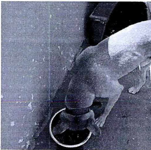
En la imagen se observa que el canino cuenta con alimento y un una casa para perro.