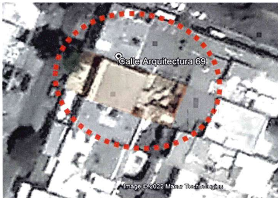
Google Earth Pro – Foto Satelital– marzo de 2020 (No se advierte alguna modificación física)