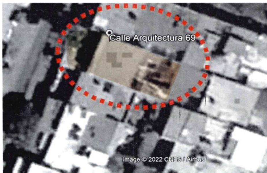
Google Earth Pro – Foto Satelital– febrero de 2021 (No se advierte alguna modificación física)