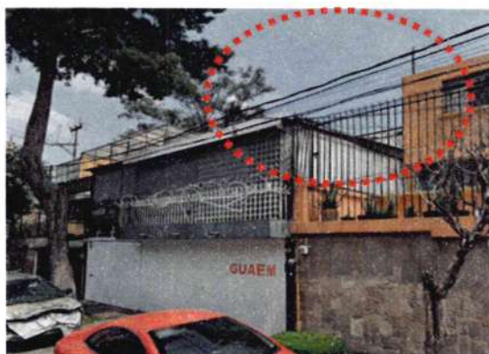
Google Maps Street View – septiembre de 2018