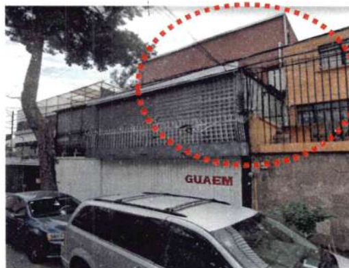
Google Maps Street View – mayo de 2022