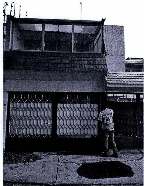
Fotografías 1 y 2.- Lugar de los hechos denunciados.

En seguimiento de lo anterior, personal de esta Subprocuraduría informó a la persona denunciante que durante visita de reconocimiento de hechos no se constató la presencia del ejemplar canino en el sitio señalado en su denuncia, por lo que los hechos que motivaron su investigación dejaron de existir.