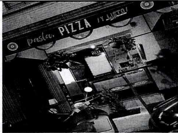
Fotografía aportada por el propietario del establecimiento, se observa un Cedro Limón.