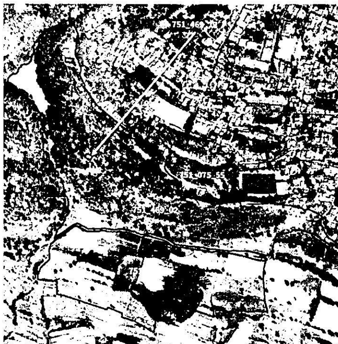
Delimitación de los predios

EL sitio de denuncia se refirió como Camino de Penetración San Pedro, San Salvador al volcán Teoca, colonia Malacaxco, Alcaldía Milpa Alta, y de las actuaciones realizadas por el personal de esta Subprocuraduría, se identificó que se ubica dentro de los predios con número de cuenta catastral 751_469_12, 751_075_55; 751_072_01 y 751_469_02, Alcaldía Milpa Alta, siendo que abarca zonas de San Bartolome Xicomulco y el terreno denominado Tecoyuco, como a continuación se muestra: -----