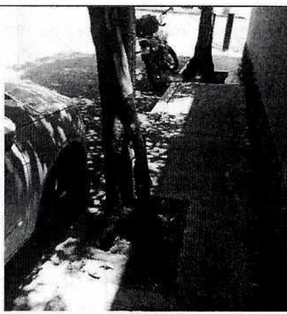
Vista de los troncos de los dos truenos.