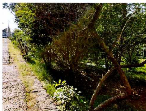
Figura 1. Vista del sitio motivo de denuncia.

En seguimiento a la denuncia, y toda vez que durante visita de reconocimiento de hechos no se constataron los hechos motivo de queja, mediante oficio PAOT-05-300/210-2337-2019, se solicitó a la persona denunciante información adicional que permitiera constatar irregularidades en materia de disposición inadecuada de residuos sólidos; otorgándole un término de cinco días hábiles; sin embargo, dicho requerimiento no fue atendido.