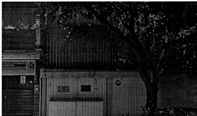
Vista del inmueble motivo de la presente denuncia.

No obstante, mediante oficio que se dejó pegado en la puerta de entrada del inmueble ubicado en calle Doctor Vertíz, número 1306, colonia Letrán Valle, Alcaldía Benito Juárez, se hicieron del conocimiento de los habitantes del referido sitio, las responsabilidades que se tienen que cumplir al tener animales de compañía, conminándolos a su debido cumplimiento.