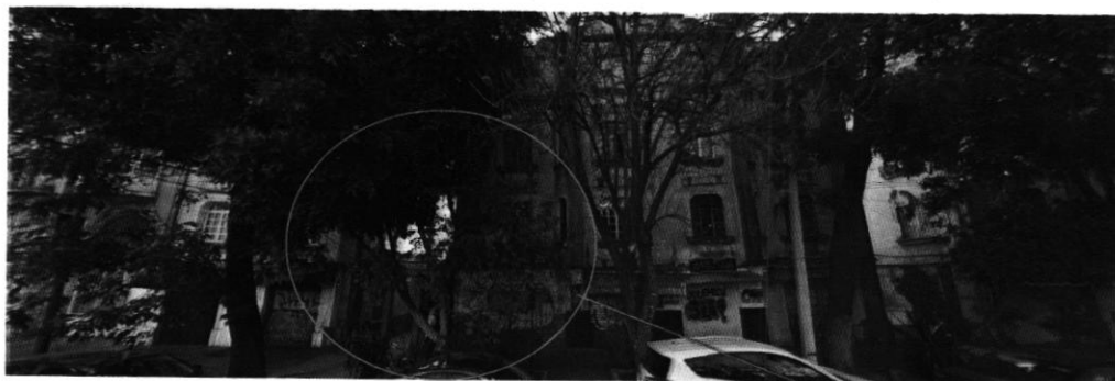
Imagen 1. Se observa el inmueble objeto de investigación.