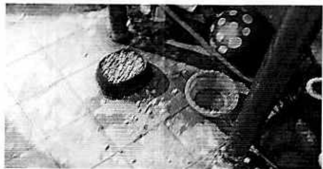
Imagen 4. Recipientes con agua y alimento