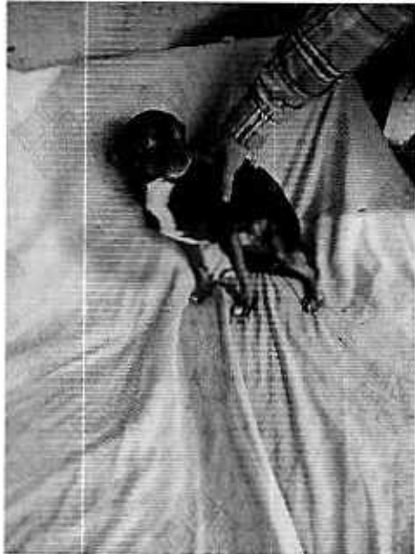
Imagen 1. Ejemplar canino de nombre "Titina"