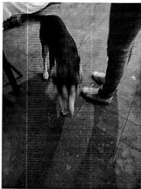
Imagen 3. Ejemplar canino de nombre "Campeón"