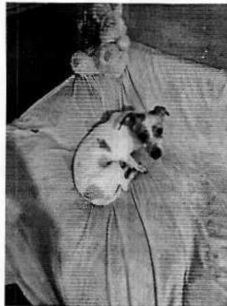
Imagen 2. Ejemplar canino de nombre "Suky"