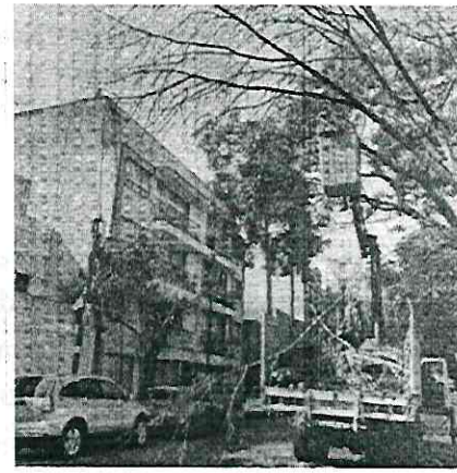
Imagen 2. Vista del citado inmueble, en imagen proporcionada por la Alcaldía Iztacalco, sólo se observa un árbol.

En ese orden de ideas, se solicitó nuevamente a la Dirección General antes referida, informar si había emitido dictamen y/o autorización, para llevar a cabo los trabajos de derribo del ejemplar arbóreo localizado en calle José María Correa, frente al número 242, colonia Viaducto Piedad, en esa demarcación territorial, lo anterior, debido a que la información que había proporcionado corresponde a una Jacaranda, localizada en el número 245, de las antes citadas calle y colonia; sin embargo, no se ha recibido el pronunciamiento correspondiente.