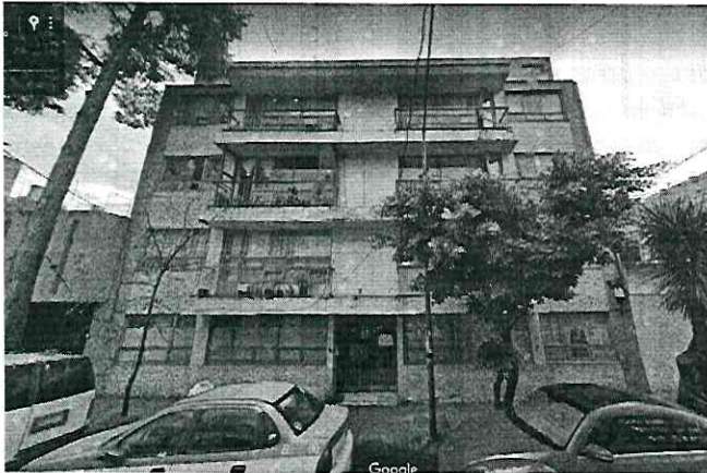
Imagen 1. Vista del inmueble ubicado en calle José María Correa, número 242, colonia Viaducto Piedad, Alcaldía Iztacalco, se observan dos sujetos arbóreos.