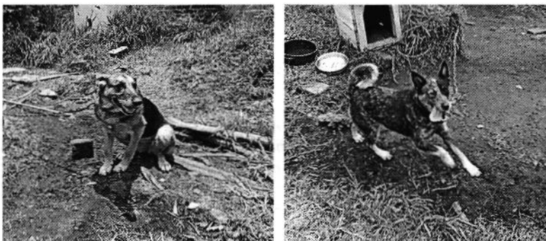
Fotografía 1 y 2. Vista de los ejemplares caninos.