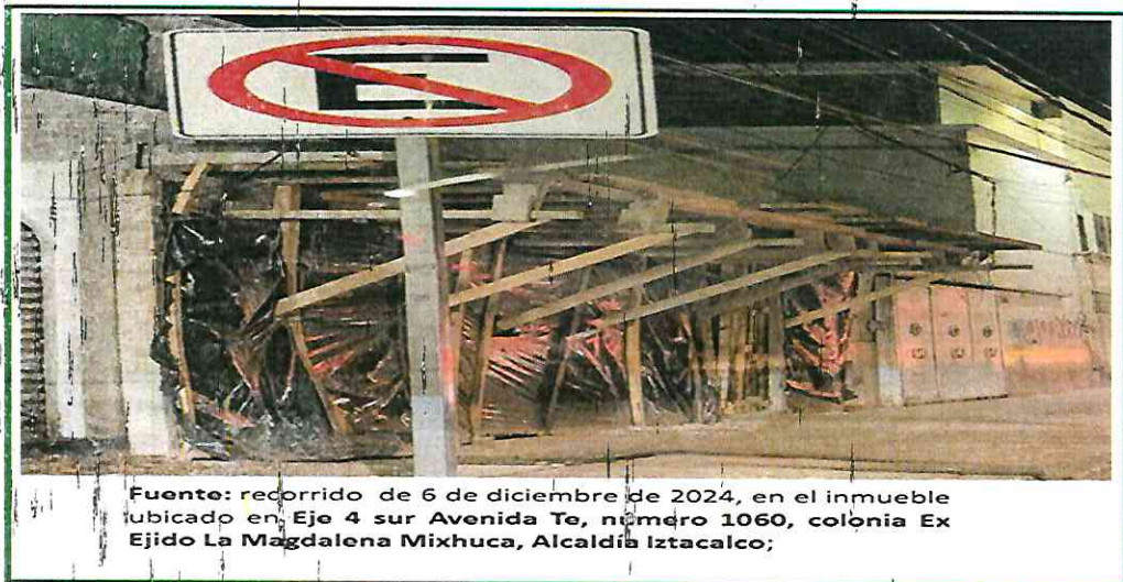
Fuente: recorrido de 6 de diciembre de 2024, en el inmueble ubicado en Eje 4 sur Avenida Te, número 1060, colonia Ex Ejido La Magdalena Mixhuca, Alcaldía Iztacalco;

I.- Que personal adscrito a esta Procuraduría, realizó en fecha 6 de diciembre del año en curso, un recorrido en el inmueble ubicado en Eje 4 Sur Avenida Te, número 1060, colonia Ex Ejido La Magdalena Mixhuca, Alcaldía Iztacalco ; en dicha diligencia se constató una obra de un nivel, delimitada con tapiales y lona negra, sin contar con un letrero en el que contenga los datos de la obra.