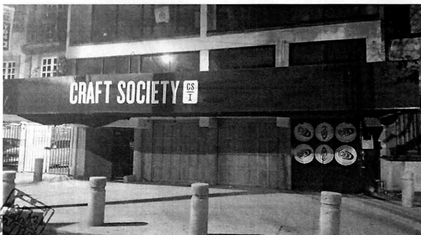
Fotografía única. Vista del establecimiento motivo de denuncia, el cual se encuentra cerrado.

Al respecto, la Dirección en comento, llevó a cabo estudio de emisiones sonoras desde el "punto de denuncia", del que se desprende que el establecimiento mercantil con denominación comercial "Craft Society" generaba un nivel sonoro de 52.70 dB(A), mismo que no excede el límite de 60 decibeles establecidos en la norma de referencia.