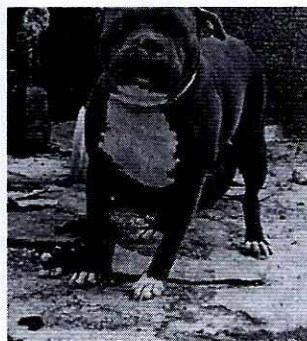
FOTOGRAFÍAS.- Vistas del ejemplar canino y del lugar donde se encontraba alojado.

Por lo anterior, mediante acto de comparecencia efectuado ante esta entidad, un habitante de inmueble motivo de denuncia, manifestó: