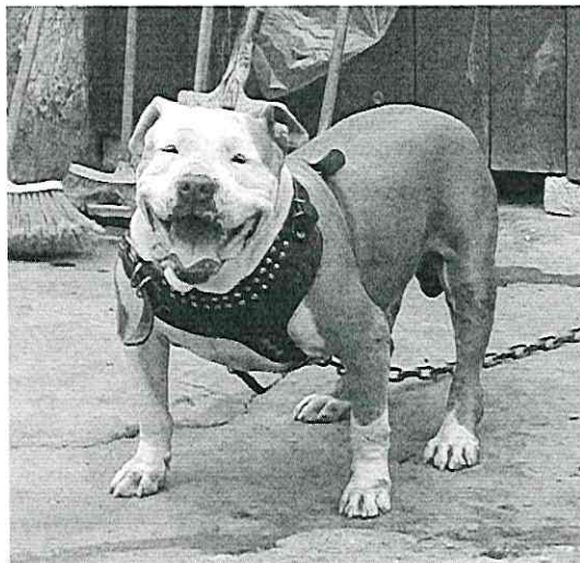
Vista del canino "Tayler", ya no presenta lesiones en rostro.

Posteriormente y en seguimiento a las lesiones que dicho ejemplar canino presentaba en la cara, el responsable de "Tayler", informó que había lo llevado al médico veterinario, exhibiendo para tales efectos las recetas médicas; asimismo, se realizó un reconocimiento de hechos, constatando que el ejemplar canino, ya no presenta lesiones en la cara o alguna otra parte de su cuerpo, así como que continua en condiciones de alojamiento similares, a las descritas en los párrafos que anteceden.