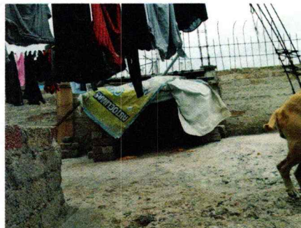
Fotografía 1-3. Ejemplares caninos motivo de denuncia y el sitio de alojamiento.