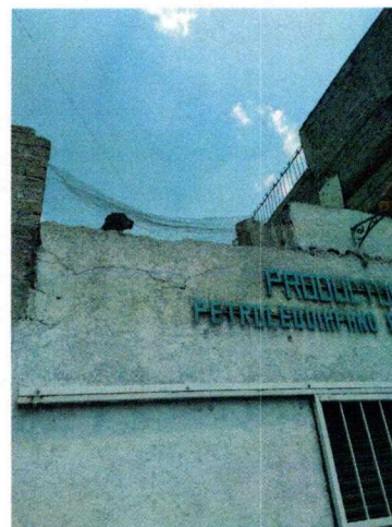
Fotografía 1-2. Inmueble motivo de denuncia.

En este sentido, de las constancias que obran en el presente expediente, se desprende que con el propósito de obtener mayor información específicamente para saber si los hechos denunciados continúan, personal de esta Subprocuraduría, envió correo electrónico a la dirección autorizada para oír y recibir notificaciones por parte de la persona denunciante, sin embargo dicho requerimiento no fue atendido.