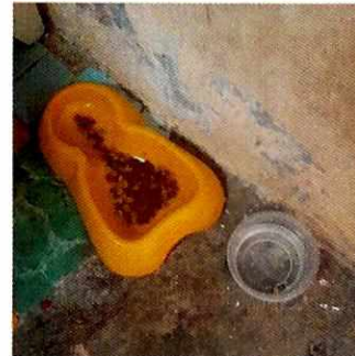
Fotografía 3. Agua y alimento.

En seguimiento al presente caso personal de esta Subprocuraduría mantuvo comunicación con la persona encargada del cuidado del ejemplar felino; la cual remitió evidencia de las constantes curaciones que le realiza en casa al ejemplar felino motivo de denuncia; no obstante, se le hizo del conocimiento que era necesario acreditar que el ejemplar felino estuviera recibiendo atención de un Médico Veterinario, con la finalidad de constar la atención médica especializada, del gato de nombre "Balú".