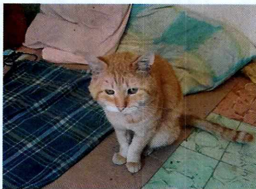
Fotografía 1. Ejemplar denunciado de nombre "Balú".