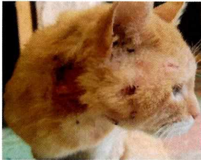
Fotografía 2. Lesión en el ejemplar felino.

No. Folio: PAOT-05-300/200- 17/6 05 -2022