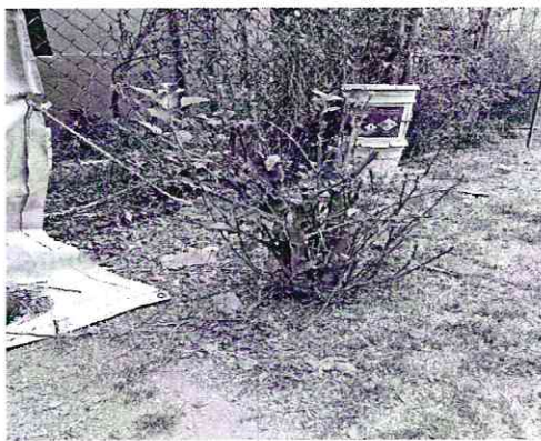
Imágenes 1-2.- (izquierda) nopal, (derecha) ciruelo, vegetación afectada, objeto de investigación

Al respecto, se sostuvo comparecencia con la persona responsable de los hechos denunciados, a quien se le hizo de conocimiento lo establecido en la normatividad ambiental, motivo por el cual se comprometió a que en lo subsecuente, solicitará autorización a la autoridad correspondiente para realizar poda o derribo de arbolado. De igual forma, de conformidad con lo establecido en el artículo 5 fracción XIX de la Ley Orgánica de la Procuraduría Ambiental y del Ordenamiento Territorial de la Ciudad de México, se promovió el cumplimiento voluntario por parte del responsable, quien con la finalidad de llevar a cabo la compensación de la biomasa afectada, se comprometió a entregar tres árboles, mismos que fueron plantados en el área común del edificio 12-C de la Unidad Habitacional denominada FIVIPOINT.