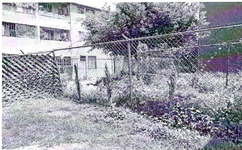
Imagen 3. Se muestran los árboles con los que se compensó el daño a la biomasa vegetal.

Por lo anterior y no quedando actuaciones pendientes por parte de esta Procuraduría, se procede a dar por concluida la investigación de la denuncia ciudadana bajo el número de expediente citado al rubro, con fundamento en el artículo 27 fracción VII de la Ley Orgánica de la Procuraduría Ambiental y del Ordenamiento Territorial de la Ciudad de México.