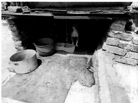
Figuras 1-2. Vista del ejemplar motivo de denuncia.