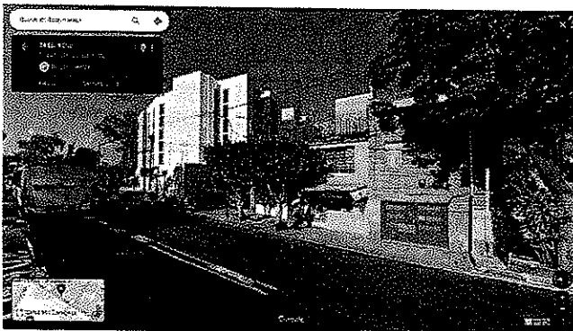
Imagen No. 3 – Se observa predio objeto de investigación concluido y habitado.