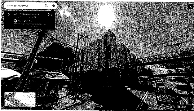
Imagen No. 1 – Se observa predio objeto de investigación concluido y habitado.

Fuente: captura de Street View de agosto 2023.