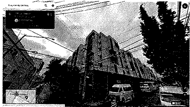
Imagen No. 2 – Se observa predio objeto de investigación concluido y habitado.