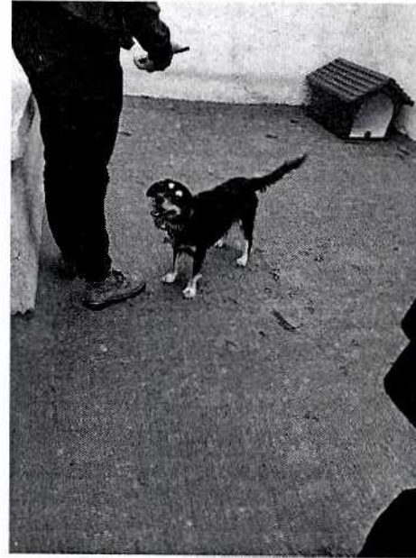
Imagen 2. Lugar de alojamiento por las tarde.