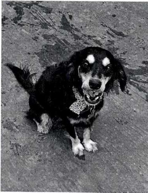
Imagen 1. Ejemplar motivo de denuncia.