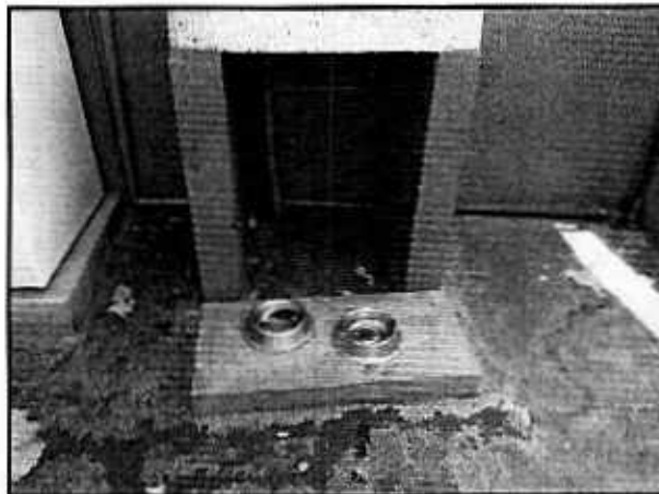
Imagen. Recipientes en donde se le proporciona alimento y agua limpia.

En cuanto a su comportamiento, se observó que mantiene una postura relajada y contacto visual sin manifestar agresión; asimismo, permite el contacto físico y se muestra dispuesto al juego de manera inmediata; en este sentido derivado del comportamiento mostrado por el ejemplar canino se deduce que no presenta signos de estrés o aislamiento; asimismo, no se observaron lesiones evidentes.